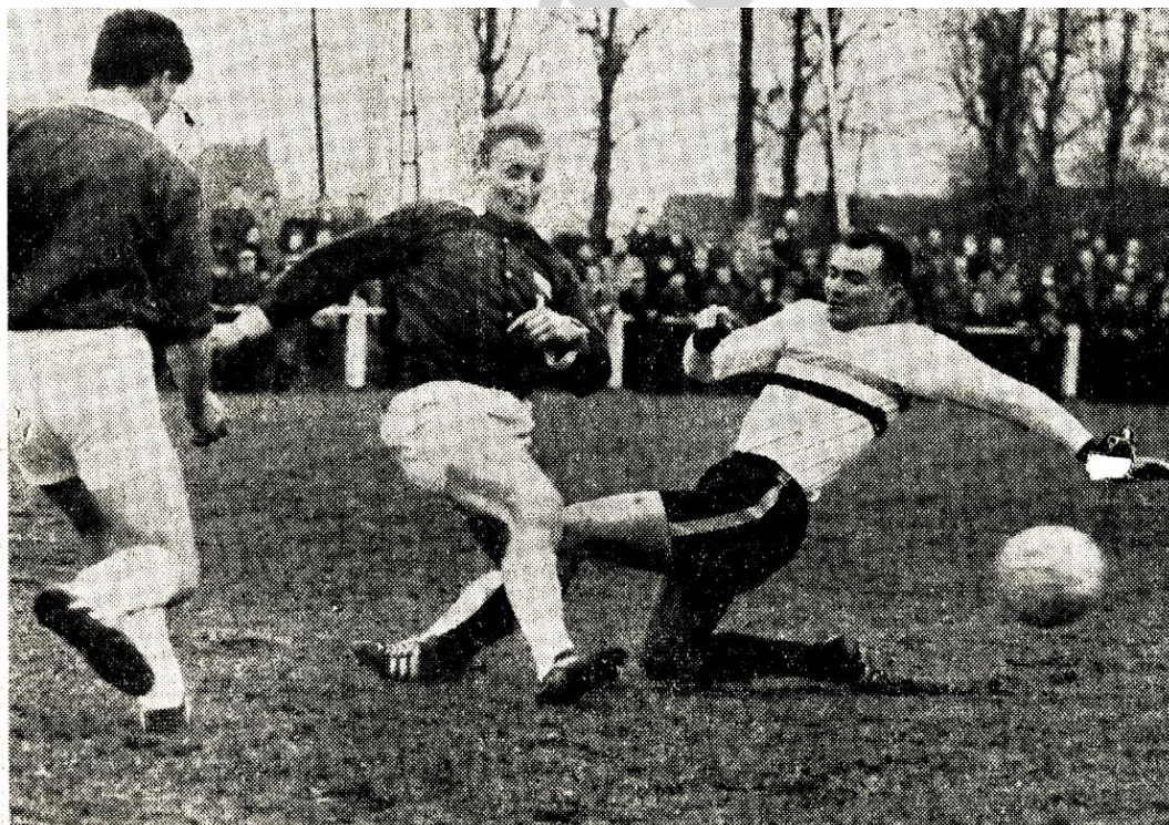
S.K. DEINZE—W.S. IEPER (3—3) — De Deinzenaar gh Versteyn. De Ridder (witte trui) zal het doelen belet worden door een kordate tussenkomst van een Iepers verdediger. — (V. - Rol.)